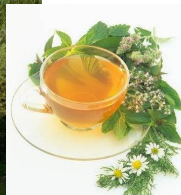
Карточка № 4